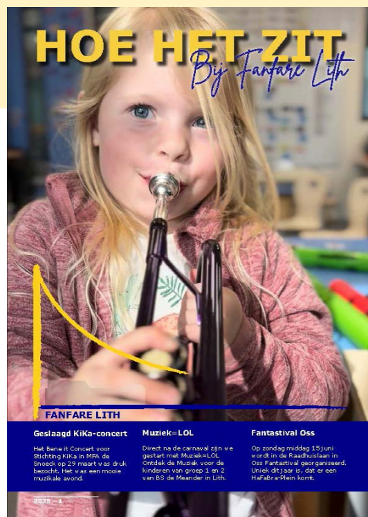
FOTO OP DE KAFT