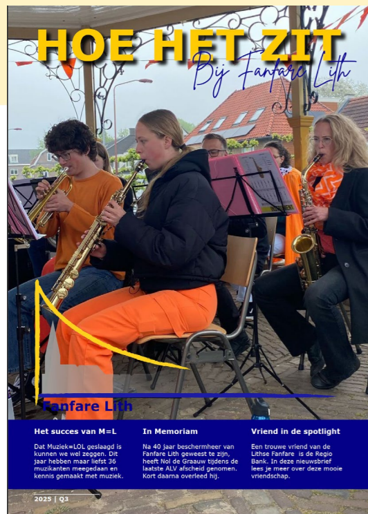
FOTO OP DE KAFT

Op de voorkant staat een foto van het optreden van het NieuwOrkest tijdens Koningsdag dit jaar.