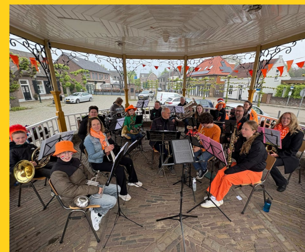
Koningsdag Concert op de Kiosk