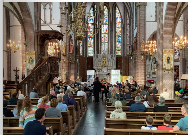
NieuwOrkest en Fanfare Orkest tijdens de Open Monumenten Dag - St. Lambertuskerk Lith

Lijkt het je leuk om een van bovenstaande commissies te versterken, geef het dan vooral even aan!