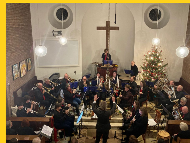
Kerstconcert in 't Kleine Kerkje aan de Maas