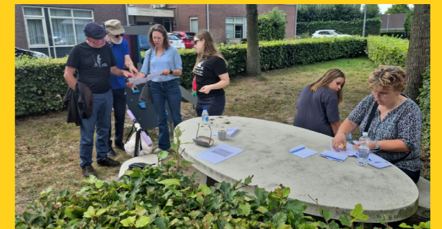
Puzzelen bij een post