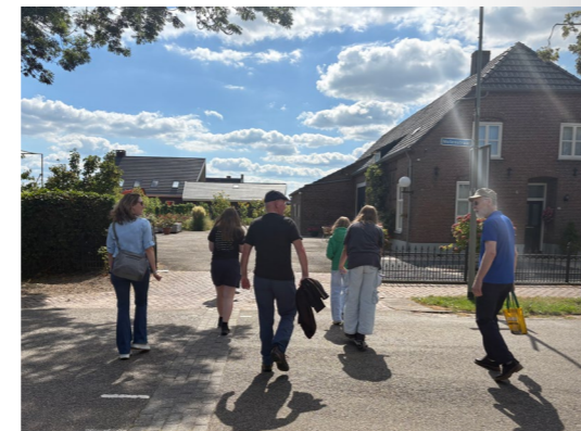
De posten zitten klaar met drinken en ijs voor de wandelaars, dus de groepen kunnen vertrekken.

Naast de opdrachten van de speurtocht kregen de groepen ook extra opdrachten via !!APP ALERT!! om extra punten mee te verdienen. Deze opdrachten kregen in een groepsapp en deze moesten zo snel en creatief mogelijk uitgevoerd worden. Er zijn heel wat leuke foto's en antwoorden voorbij gekomen bij de organisatie!