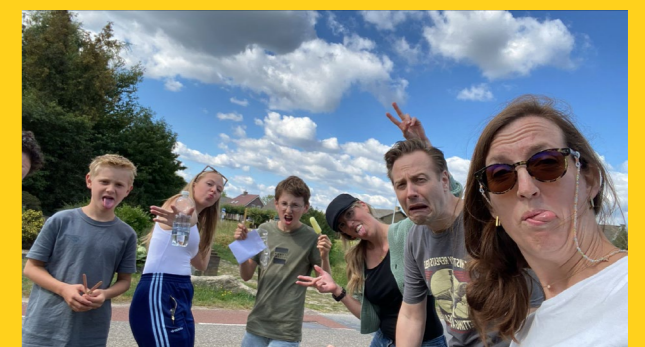
Een gekke groepsfoto