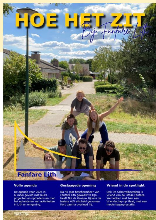
FOTO OP DE KAFT

“Maak een leuke groepsfoto” was een van de opdrachten tijdens de puzzeltocht door Lith tijdens de opening van het seizoen. Deze groep is hier zeker in geslaagd!