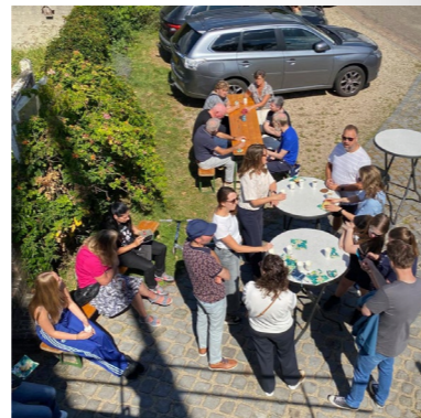
Gezellig met z'n alle bij de molen voor koffie, thee en wat lekkers.

Nadat de mensen voor de posten waren geïnstrueerd en onderweg waren konden de drie groepen zich klaarmaken voor de speurtocht. Elke groep was een mix van muzikanten uit het NieuwOrkest en het FanfareOrkest. De groepen hadden allemaal dezelfde route, daarom vertrokken ze ongeveer met tussenpozen van 10 minuten.