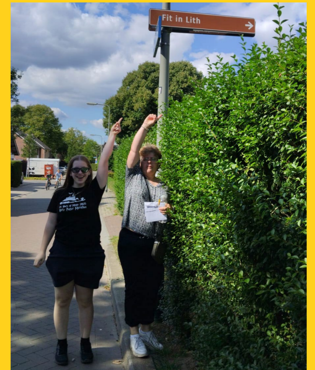
Een foto met "Lith" erop